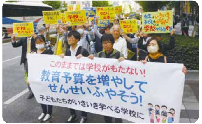
このままでは学校がもたない! 全国集会10.7 銀座パレード